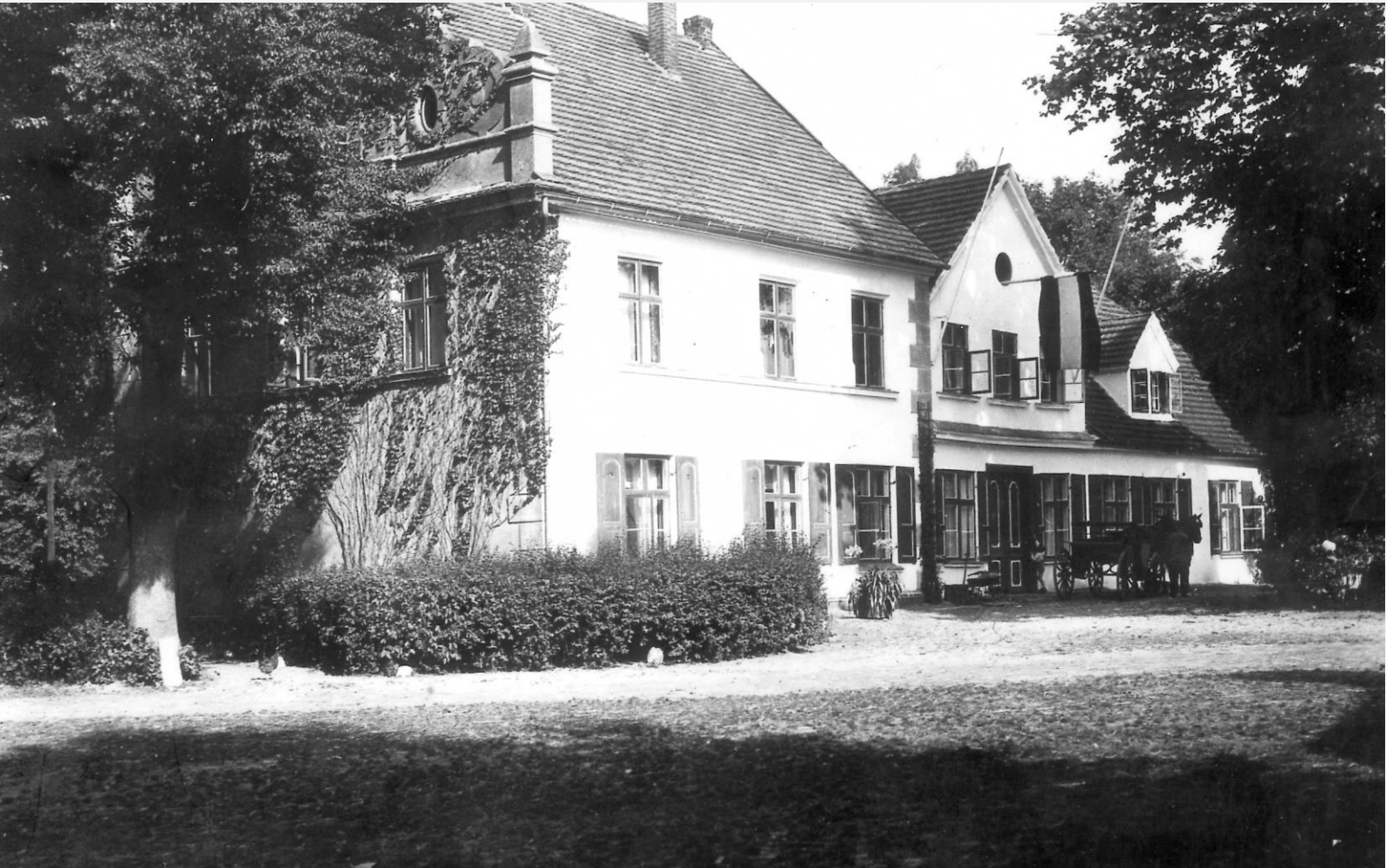
Gutshaus Behrenshagen, Historische Postkarte

Sonnabend, 19. Juli 2025 | 12.00 Uhr Treffpunkt: 18320 Behrenshagen, Gutshofstraße 1