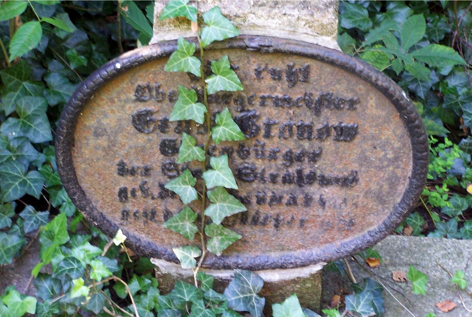
Grabplatte Oberbürgermeister Ernst Gronow, Foto: Angela Pfennig 2011