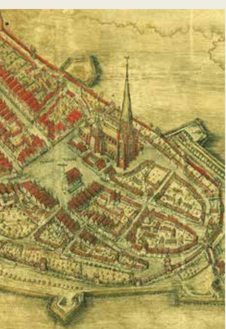
Ausschnitt Stauedplan 1647