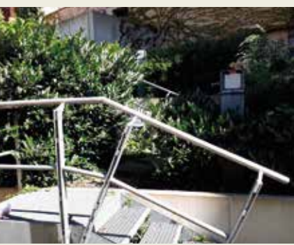
Amtsgerichtsgarten Bielkenhagen 8/9 18439 Stralsund

Rückzugsort der Stille für Hotelgäste und Besucher_innen. Der gastronomisch genutzte historische Innenhof verbindet die sanierten Häuser des Scheelehofes. Eine wechselnde Kübelbepflanzung mit Blumen, Kräutern in Hochbeeten für die Küche des Hauses sowie Fassadenberankungen mit Efeu und wildem Wein setzen gärtnerische Akzente.