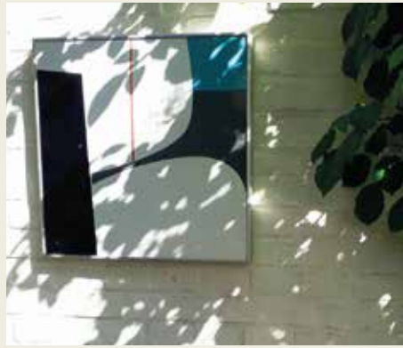
Nur während der Führungen zu besichtigen.

Stadtgarten. In der Tradition der Ringmäuergärten des 18. Jahrhunderts gestalten die Eigentümer unmittelbar an der Stadtmauer auf dem Gelände einer ehemaligen Dampfmaschine seit 30 Jahren einen Familiengarten unter dem schützenden Dach einer alten Linde. Flieder, Rhododendron, Hortensien, Funkien, Rosen, Stauden, Kräuter, Klettergehölze und Topfkulturen sowie Ziergehölze bilden locker verteilte Pflanzinseln im Rasen, umspielen die behaglichen Sitzplätze und geben dem Raum Struktur. Viele Pflanzen sind mit persönlichen Erinnerungen an Menschen aus dem Familien- und Freundeskreis verbunden. Künstlerische Werke des Bildhauers Reinhard Dietrich und des Metall- und Emaille-Gestalters Helmut Senf verschmelzen mit dem natürlich Gewachsenen zu einer Einheit.