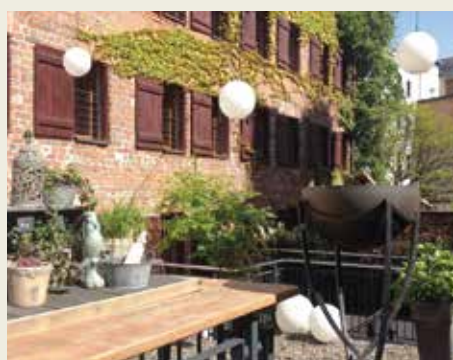
Romantik Hotel Scheelehof Fährstraße 23-25 18439 Stralsund

Ein Freiraum der vielen Möglichkeiten. Der mit Katzenköpfen gepflasterte Hof des Ende der 1990er Jahre sanierten Wohn- und Geschäftshauses verdankt seine südliche Atmosphäre vor allem den üppigen Klettergehölzen Blauregen und Kiwi. Während der Nacht des offenen Denkmals bot er viele Jahre einen stimmungsvollen Rahmen für kulturelle Darbietungen des Musikhauses.