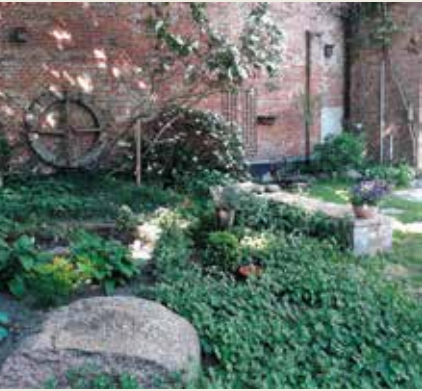
Familie Eriksson Katharinenberg 37 18439 Stralsund

Hortus conclusus. Der Amtsgerichtsgarten wurde im Zusammenhang mit der Sanierung des Amtsgerichtes 2007 nach einem Entwurf des Landschaftsarchitekturbüros Osigus + Meimerstorf auf dem ehemaligen Gefängnishof angelegt. Umgeben von hohen Mauern und den Gebäuden des Gerichtes bietet er den Mitarbeiter_innen eine grüne Oase der Erholung. Die Höhenunterschiede im Terrain wurden nicht überspielt, sondern durch helle Sichtbetonmauern zum Gestaltungsthema gemacht. Sie schaffen eine klare Terrassierung. Auch die flächige geschwungene Pflanzung von immergrünen Gehölzen wie Kirschlorbeer, Heckenkirsche, Immergrün und Buchsbaum sowie Hortensien spielt mit diesen Höhenunterschieden. Eingestreute Solitärsträucher wie Felsenbirnen und Korkspindelstrauch lockern die grafisch gestaltete Hofsituation auf und bieten jahreszeitliche Motive der Blüte und Herbstfärbung. Stahltreppe dienen als Rettungsweg.