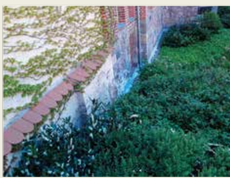
Nur während der Führungen zu besichtigen.

Hortus conclusus. Der Amtsgerichtsgarten wurde im Zusammenhang mit der Sanierung des Amtsgerichtes 2007 nach einem Entwurf des Landschaftsarchitekturbüros Osigus + Meimerstorf auf dem ehemaligen Gefängnishof angelegt. Umgeben von hohen Mauern und den Gebäuden des Gerichtes bietet er den Mitarbeiter_innen eine grüne Oase der Erholung. Die Höhenunterschiede im Terrain wurden nicht überspielt, sondern durch helle Sichtbetonmauern zum Gestaltungsthema gemacht. Sie schaffen eine klare Terrassierung. Auch die flächige geschwungene Pflanzung von immergrünen Gehölzen wie Kirschlorbeer, Heckenkirsche, Immergrün und Buchsbaum sowie Hortensien spielt mit diesen Höhenunterschieden. Eingestreute Solitärsträucher wie Felsenbirnen und Korkspindelstrauch lockern die grafisch gestaltete Hofsituation auf und bieten jahreszeitliche Motive der Blüte und Herbstfärbung. Stahltreppe dienen als Rettungsweg.