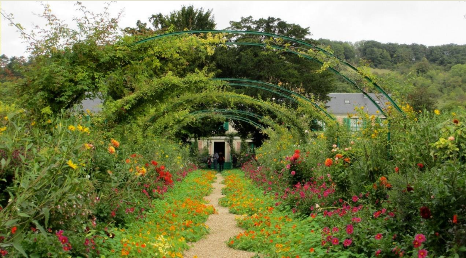
Monet-Garten in Giverny

Montag, 1. Februar 2016 | 17.30 Uhr Galerie KUNSTundCO, Mönchstraße 50