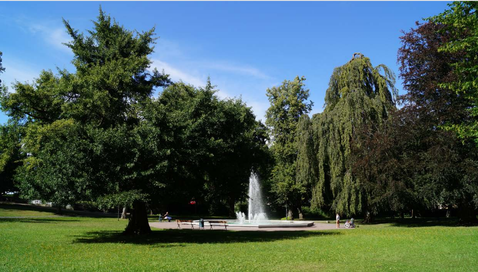
Brunnenau, Foto: Martin Jeschke 2012

Montag, 3. November 2014 | 19.30 Uhr Galerie KUNSTundCO, Mönchstraße 50