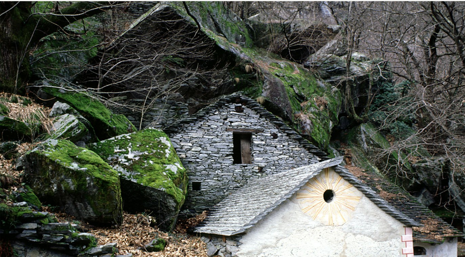
Cevio Vecchio – Grotti, Foto: Peter Degen

Montag, 5. Mai 2014 | 17.30 Uhr Galerie KUNSTundCO, Mönchstraße 50