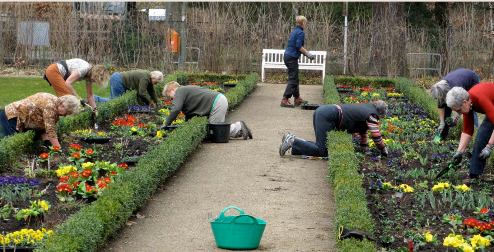
Ehrenamtliches Gärtnern im Liebermann-Garten

Montag, 3. Februar 2014 | 17.30 Uhr Galerie KUNSTundCO, Mönchstraße 50