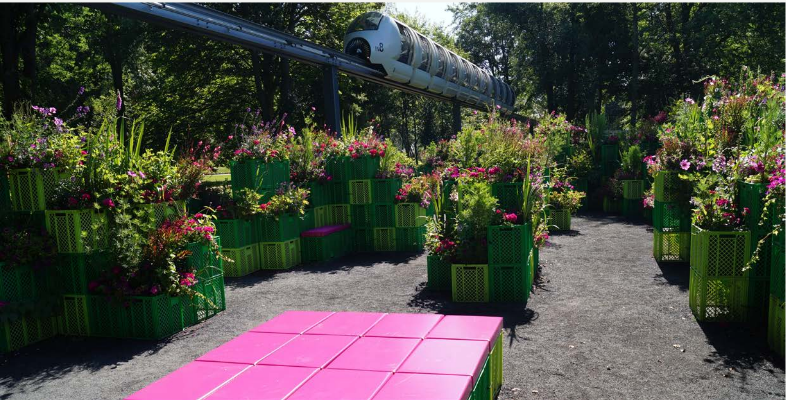
Garten der Symbolik, Foto: Martin Jeschke

Montag, 18. November 2013 | 17.30 Uhr Galerie KUNSTundCO, Mönchstraße 50